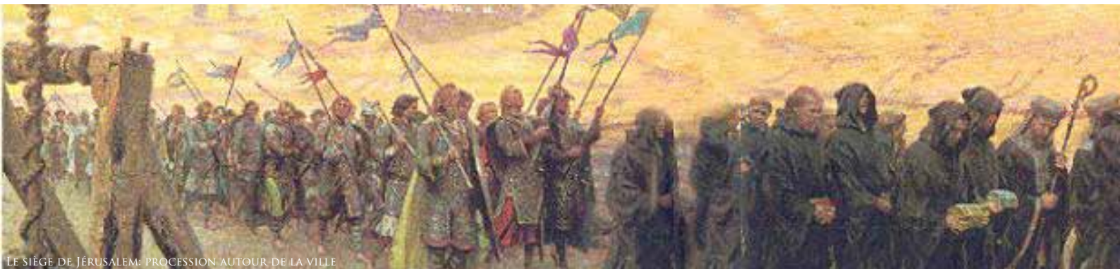
LE SIÈGE DE JÉRUSALEM: PROCESSION AUTOUR DE LA VILLE