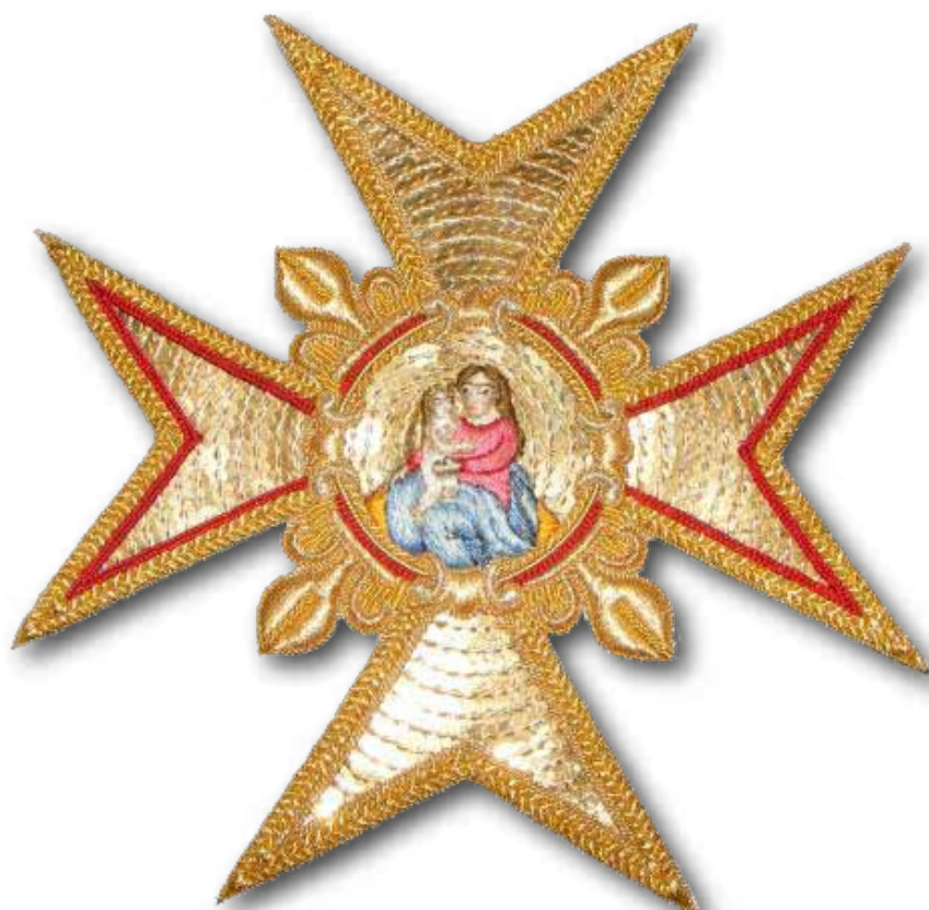
INSIGNE DE L'ORDRE DE NOTRE-DAME DU MONT-CARMIEL

Vers 1750 on ajouta aux insignes la devise «Dieu et mon Roi» et la croix fût sommée d'une couronne. Lors du chapitre tenu le 19 avril 1774 en